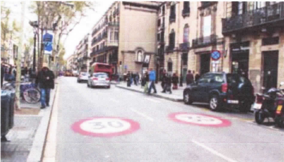
Via de uso compartido con velocidad máxima de 30 km/h.