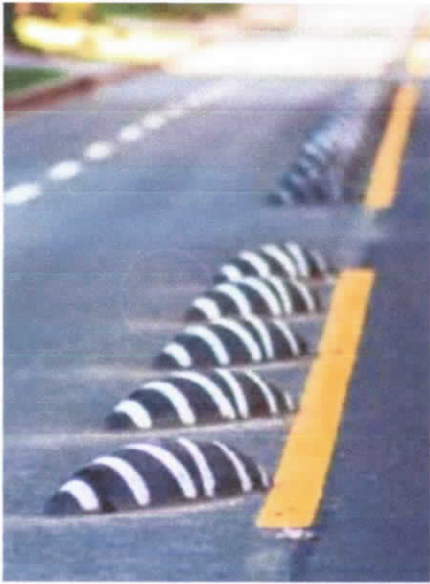
Ejemplo de separadores, Providencia

VIALIDAD CICLO-INCLUSIVA. RECOMENDACIONES DE DISEÑO