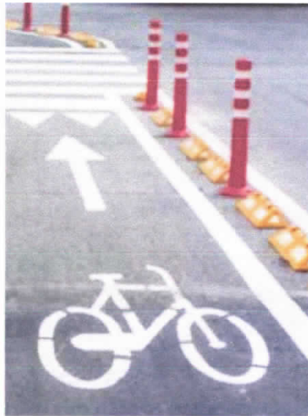
Ejemplo de hitos verticales de poliuretano, Bogotá