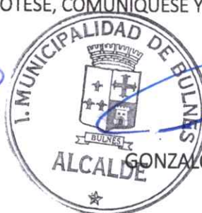
GONZALO BUSTAMANTE TRONCOSO ALCALDE