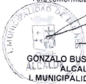
GONZALO BUSTAMANTE TRONCOSO ALCALDE I. MUNICIPALIDAD DE BULNES